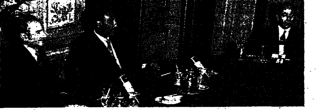
الرئيس السادات وشاه ايران أثناء المباحثات أمس، ويبدو الدكتور عبد العزيز حجازي